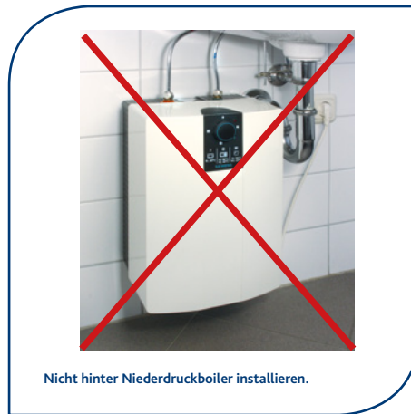
Nicht hinter Niederdruckboiler installieren.

Filtersysteme dürfen niemals hinter einem Niederdruckboiler (druckloser Boiler oder druckloser Durchlauferhitzer) installiert werden!